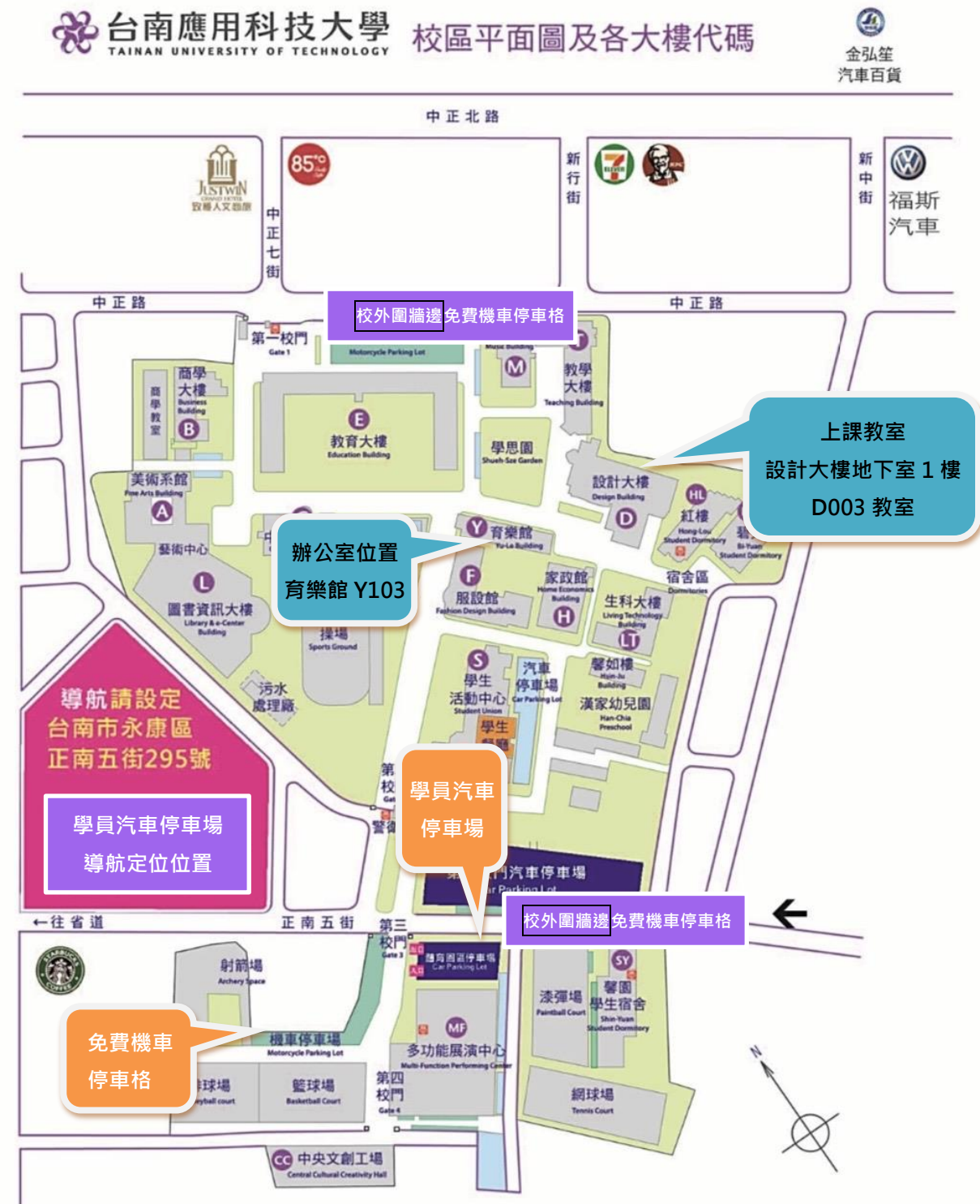
本校校區平面位置圖